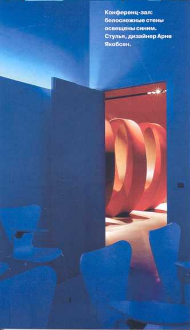
Конференц-зал: белоснежные стены освещены синим. Стулья, дизайнер Арне Якобсен.