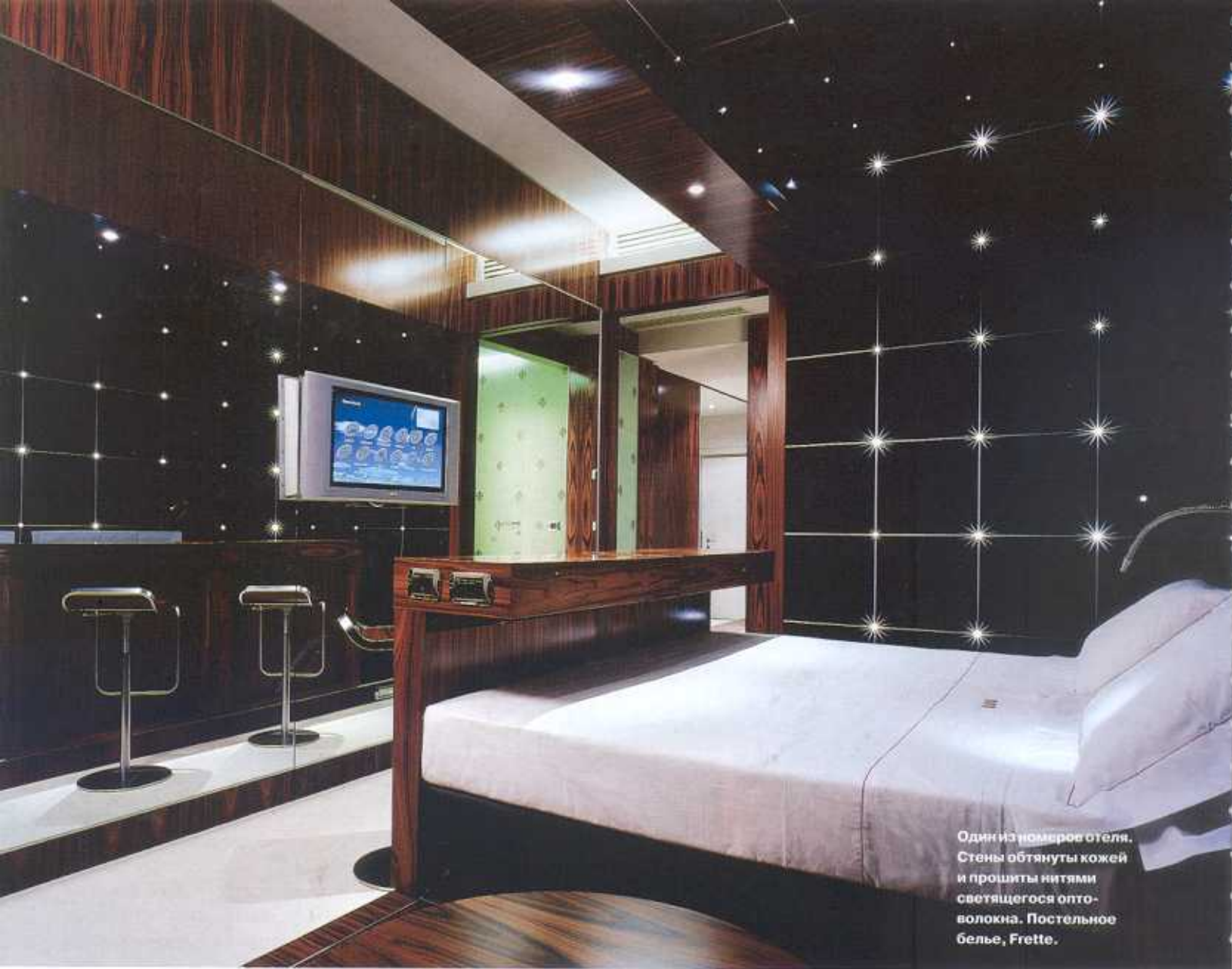
Один из номеров отеля. Стены обтянуты кожей и прошиты нитями светящегося оптоволокна. Постельное белье, Frette.

> выкрашены в белый цвет, но по желанию заседающих их можно осветить красным, желтым, зеленым, синим и даже цветом фуксии. Делается это с помощью аппаратуры, которую Новембре применяет в своих ночных клубах.