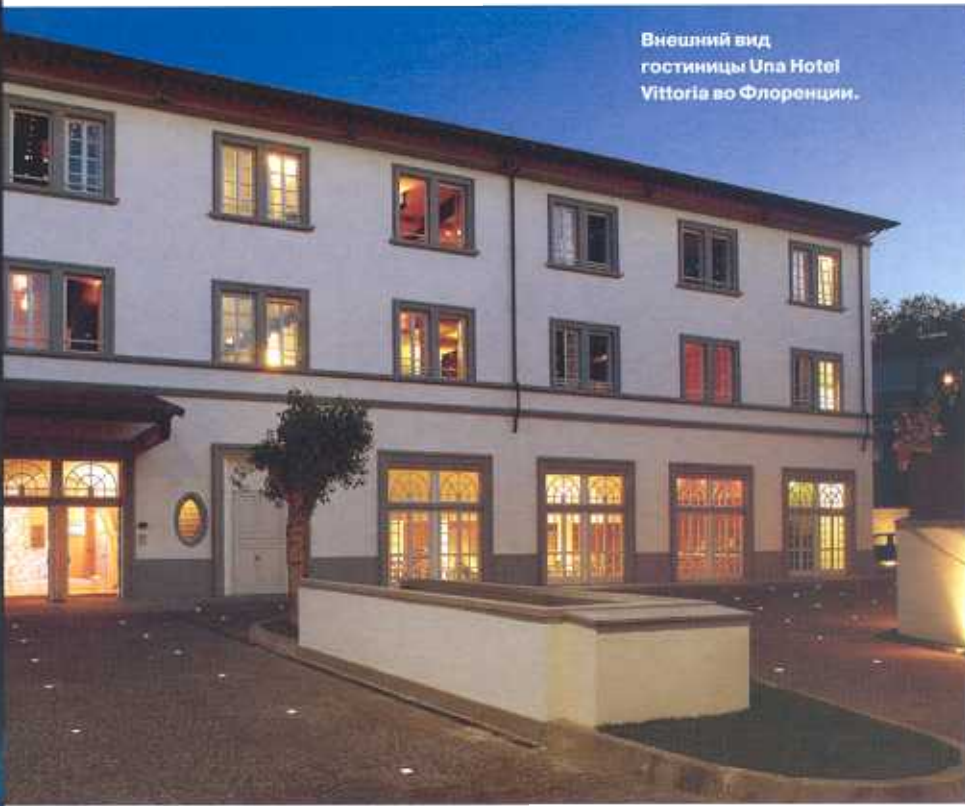
Внешний вид гостиницы Una Hotel Vittoria во Флоренции.