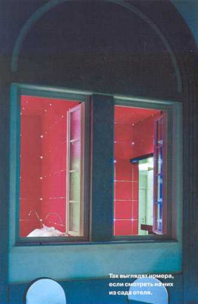
Так выглядят номера, если смотреть на них из сада отеля.