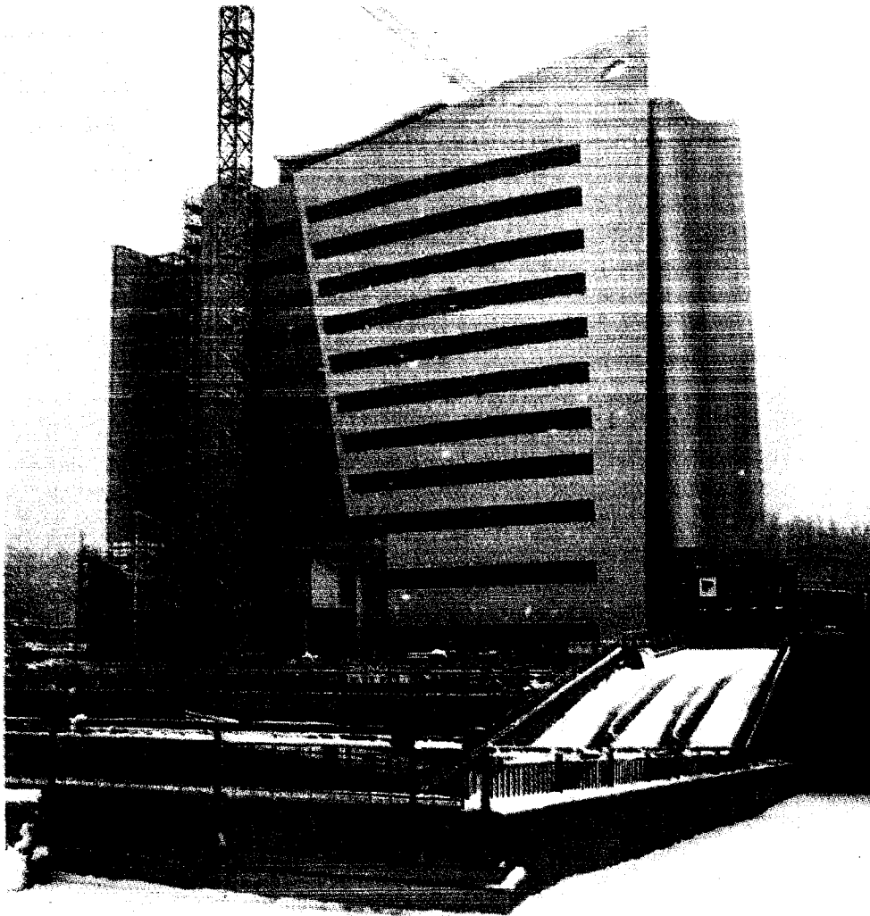
CANTIERE L'esterno del complesso alberghiero di via Turati

L'edificio si ispira all'area dei lavori: sarà il luogo del movimento Avrà 160 camere, per 250 posti letto, tre sale riunioni e un ristorante