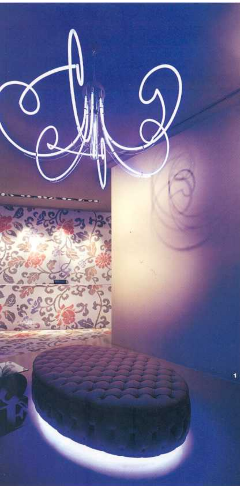
1 Neonröhren und Blumenmuster: das Foyer mit Mosaik und Lichteffekten. 2 „AND“-Sofas in Form von Schleifen hat Fabio Novembre für Cappellini entworfen. 3 Hinter der Fassade versteckt sich eine farbige Designwelt. 4 Am Empfangstresen gehen Wände, Boden und Decke ineinander über. 5 Kleine Räume mit großer Wirkung durch raffinierte Spiegelungen. 6 Die golden gerahmten Porträts machen aus Türen „Kunstwerke“.