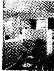
L'interno del nuovo Una Hotel di Bologna.

Ha aperto le porte il nuovo Una Hotel Bologna . L'albergo, di fronte alla stazione e a pochi passi dal centro e dalla Fiera, è dotato di 93 camere, sei suite, tre sale riunioni, un bar con terrazza, ristorante e garage interno.