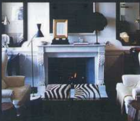
J.K. PLACE IL SALOTTO D'ISPIRAZIONE ETNO CHIC (A. G.)