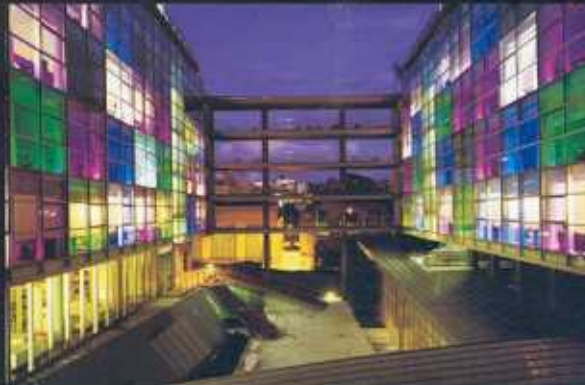
ES HOTEL SUGGERITIVO PANORAMA ESTERNO BY NIGHT (N. 15)