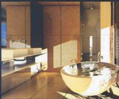
BULGARI DETTAGLIO DELLA SALLE DE BAIN (N. 45)