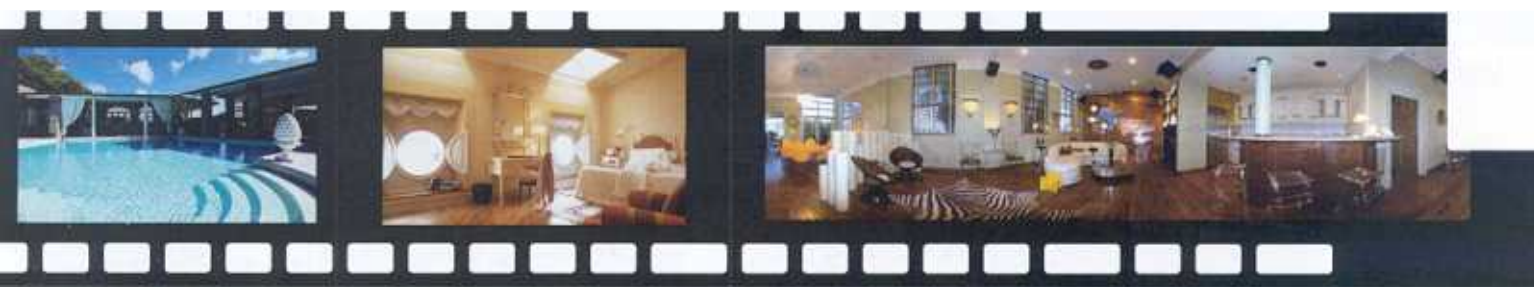
5. COTTON HOUSE (MUSTIQUE, CARAIBI) 6. ALBERGO PIETRASANTA (PIETRASANTA), 7. PELICAN (MIAMI)