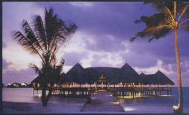
SONEVA GILI SPETTACOLARE VISTA NOTTURNA DEL BEACH-BAITIK (M.)