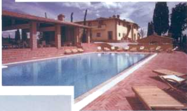
FATTORIA S. STEFANO, MONTAIONE.

Rustici, antichi casali, abitazioni coloniche. Dalla Toscana a Ibiza, un tuffo nel verde