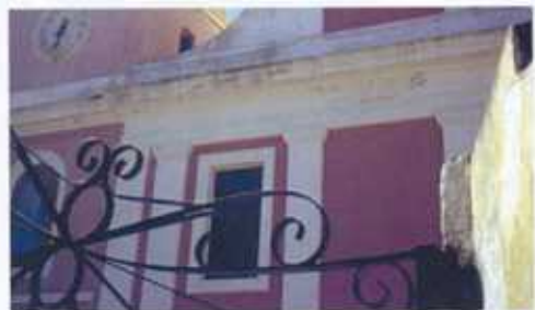
ISOLE DEL MEDITERRANEO, DALLE EOLIE, ALLA GRECIA, PER UNA VACANZA NELLA NATURA.