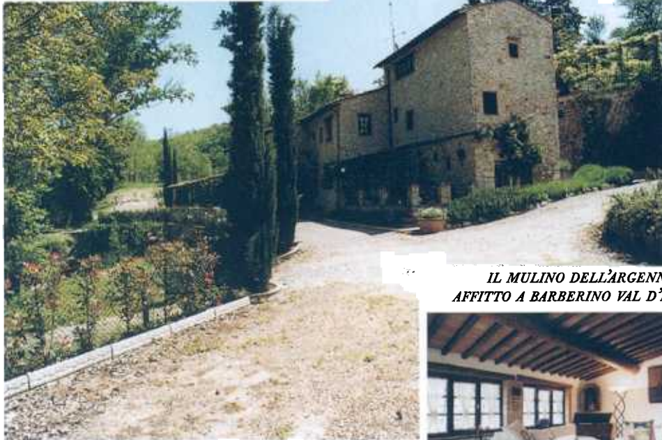
IL MULINO DELL'ARGENNA, IN AFFITTO A BARBERINO VAL D'ELSA.