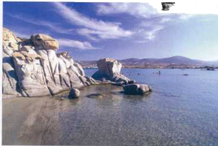
ALLE CICLADI O NELLA CAMPAGNA UMBRA, TRA GUBBIO E PERUGIA.