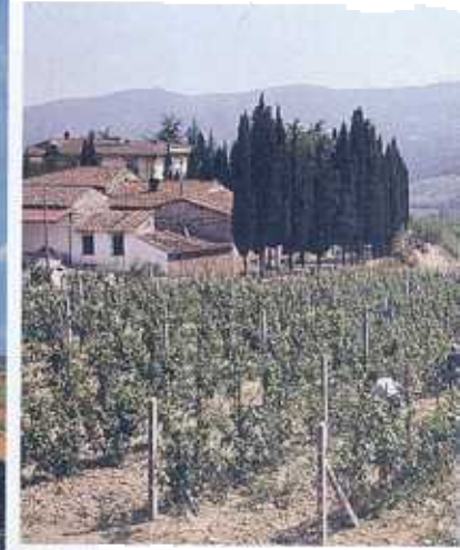
SOPRA, I VIGNETI NEL CHIANTI. SOTTO, UNA VIA TRA I SASSI DI MATERA.

Con i bambini, con gli amici, con tutta la famiglia. L'importante è essere in tanti. E riscoprire il piacere della villeggiatura. Stanziale e in una casa speciale. Due le idee: in campagna e su un'isola (ma piccola).