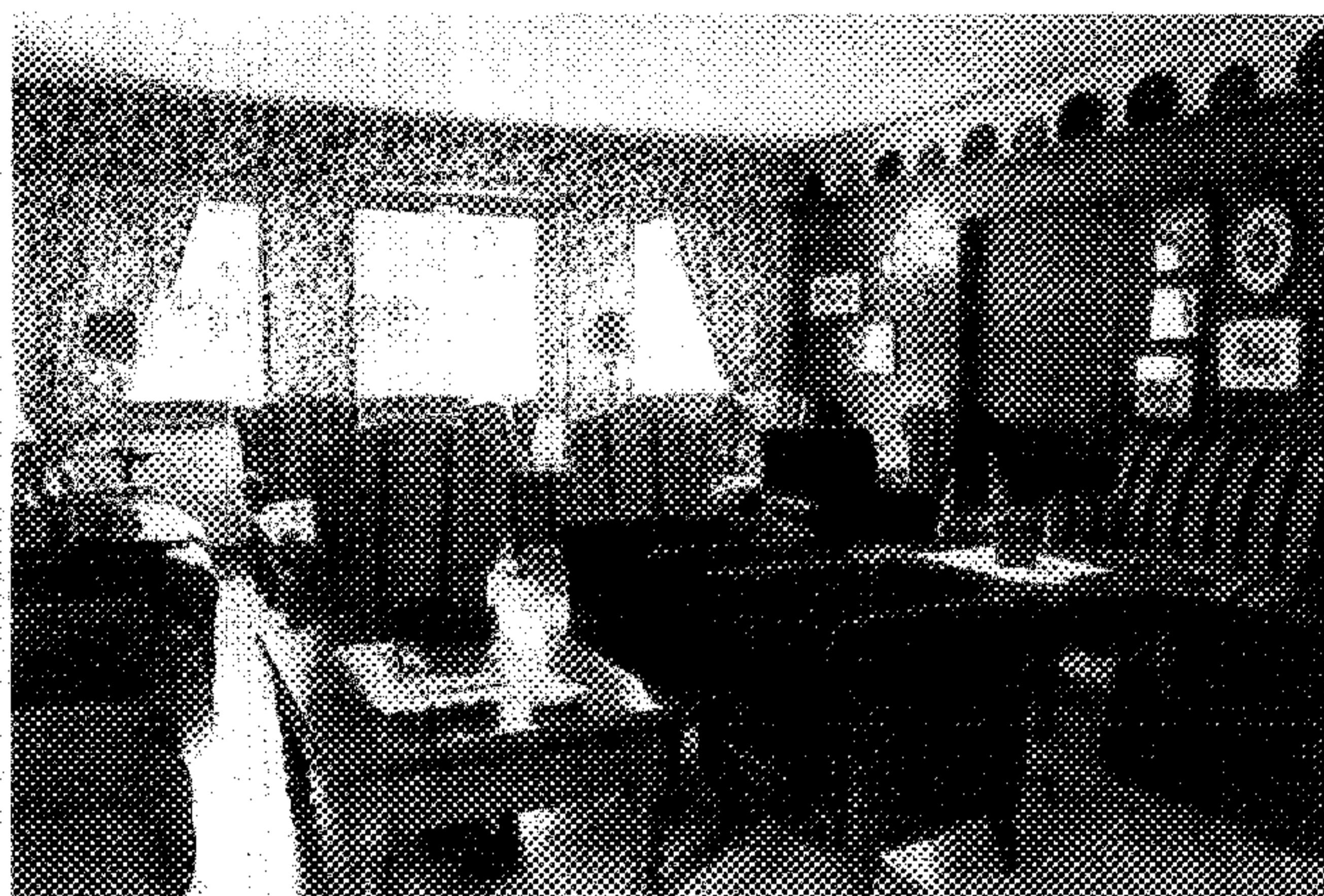
Sopra: veduta notturna del Fanes Hotel di San Cassiano in val Badia (Bolzano). A sinistra: il salotto del Romantik Hotel Villa Novecento di Courmayeur, in Valle d'Aosta.